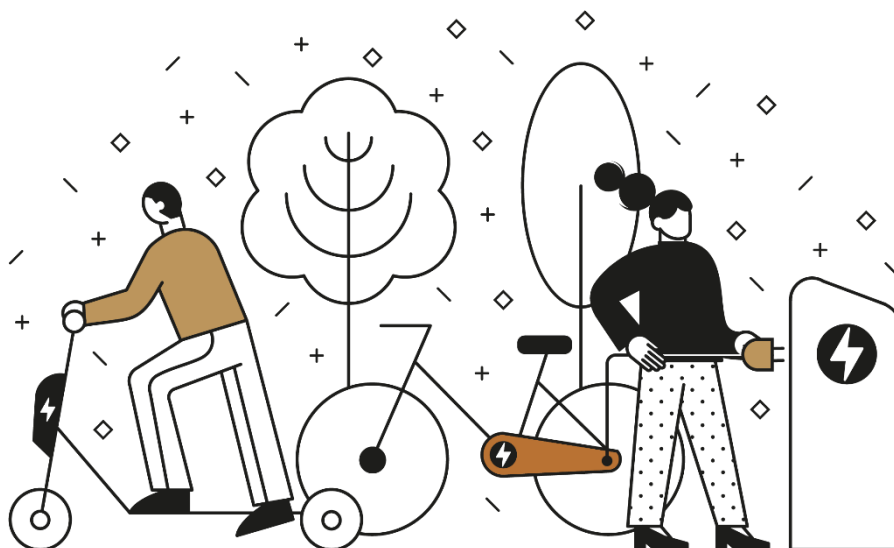
Ilustracija: Pametna sela Hrvatske / Revent Smart d.o.o.

Primjenom modernih tehnologija također se može motivirati lokalno stanovništvo za aktivno uključivanje u različite svakodnevne aktivnosti u vlastitoj lokalnoj sredini, bilo da se radi o sudjelovanju u javnim manifestacijama ili iznošenju vlastitog mišljenja o načinu rada javne uprave. Tehnologije koje se koriste u tu svrhu odnose se primarno na mobilne aplikacije za određeno područje koje će koristiti lokalno stanovništvo ili elektroničke ploče za informiranje, integrirane kartice za turiste, proširena i virtualna stvarnost, digitalni edukativni programi itd.