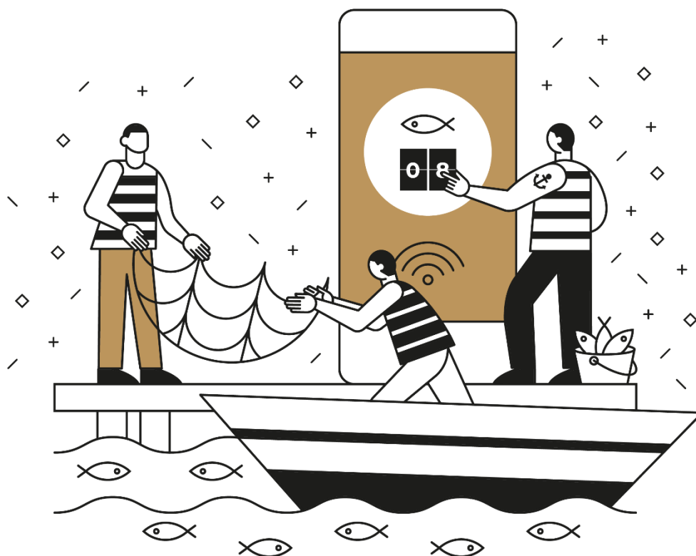
Ilustracija: Pametna sela Hrvatske / Revent Smart d.o.o.

Obzirom da se pametna sela odnose na zajednice u ruralnim područjima u kojima se prirodno kao djelatnosti ističu poljoprivreda i turizam, u nastavku su dani primjeri za navedena dva sektora.