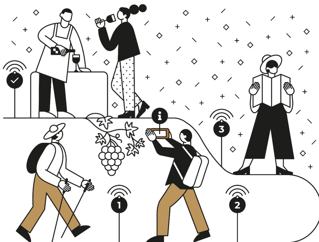
Ilustracija: Pametna sela Hrvatske

U pametnim selima tradicionalne i nove mreže i usluge unaprjeđuju se digitalnim, telekomunikacijskim tehnologijama, inovacijama i boljom uporabom znanja u korist lokalnog stanovništva i gospodarstva. Digitalne tehnologije olakšavaju brojne aktivnosti, kako poslovne tako i društvene, a njihovo korištenje preduvjet je društvenog i gospodarskog rasta i razvoja lokalnog područja što podrazumijeva i povećanje životnog standarda stanovništva i zaustavljanje negativnih demografskih trendova.