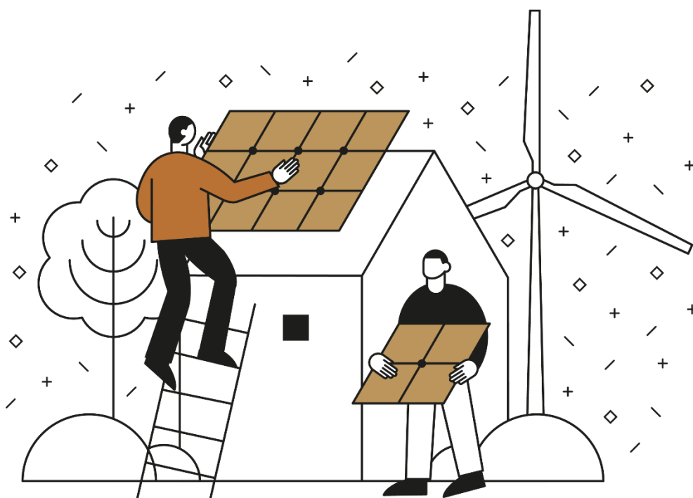
Ilustracija: Pametna sela Hrvatske / Revent Smart d.o.o.

Kada je riječ o okolišu, ruralna područja suočavaju se s brojnim problemima povezanim s narušavanjem bioraznolikosti i uništavanjem okoliša. Primjerice, za razliku od urbanih gospodarskih djelatnosti, poljoprivreda i šumarstvo mnogo su osjetljiviji na učestalije nepovoljne vremenske uvjete poput suše, poplava, mraze i tuče koji su jedan od glavnih čimbenika koji određuje prinose i kvalitetu sirovine. Zbog toga su te djelatnosti prve na udaru posljedica gubitka bioraznolikosti, što ugrožava dugoročnu gospodarsku perspektivu ruralnih zajednica koje o njima ovise. Još jedan od mogućih problema koji narušavaju bioraznolikost pojedinog područja te stvaraju gubitke u navedenim