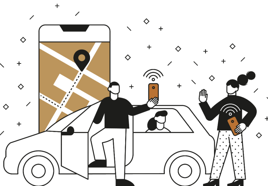
Ilustracija: Pametna sela Hrvatske / Revent Smart d.o.o.

Pametna rješenja u području prometa i mobilnosti uključuju i uspostavu inteligentnih transportnih sustava (ITS) koji omogućuju povećanje performansi, bolji tok prometa, efikasniji i sigurniji prijevoz putnika i robe te se time smanjuje zagađenje zraka i povećava udobnost putovanja. ITS obuhvaćaju gotovo sve vrste transporta (cestovni, zračni, željeznički i pomorski), a njihova najveća prednost je mogućnost povezivanja i analitike velike baze podataka te njihovoj uporabi u stvarnom vremenu za upravljanje prometnim tokovima. Konkretno primjene ITS-a očituju se korištenju senzorskih sustava i video nadzora o stanju na prometnicama, navigacijskih alata o trenutačno optimalnim prometnim smjerovima, daljinskog upravljanja promjenjivom prometnom signalizacijom, semaforima i radio-komunikacijskim porukama itd.