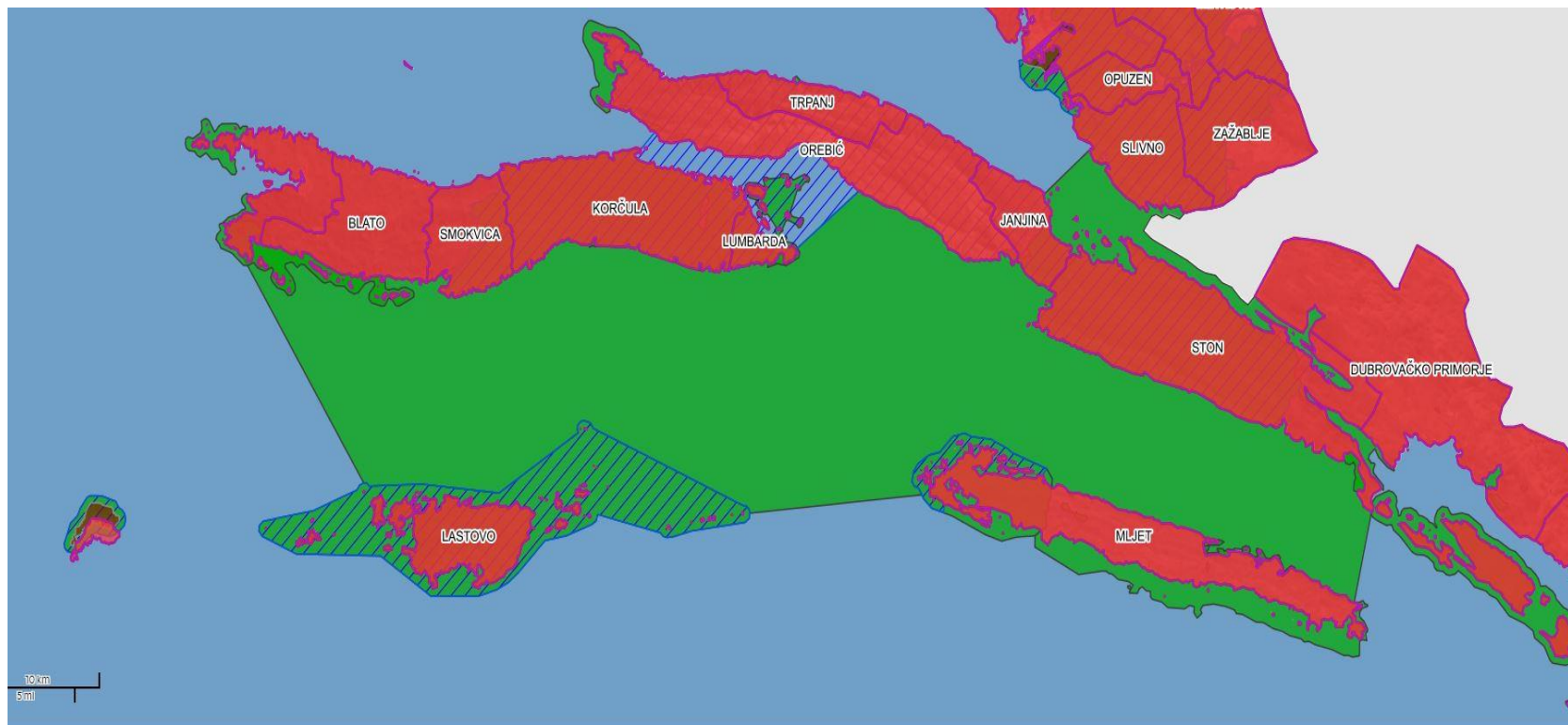
Slika 3: Ekološka mreža Natura 2000 na području LAG-a 5

Ekološka mreža NATURA 2000 područja (np. crveno i zeleno – Područja prema direktivi o staništima, iscrtano linijama – područja prema direktivi o pticama).