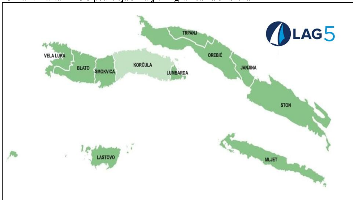
Slika 1: Karta LAG 5 područja s vidljivim granicama JLS-ova

Specifičan geografski i geoprometni položaj područja LAG-a 5 nameće potrebu poboljšanja povezanosti pojedinih dijelova unutar LAG-a 5, poluotoka Pelješca i otoka Mljeta, Korčule i Lastova te povezivanje s DNŽ i Republikom Hrvatskom (RH) kao bitnu pretpostavku daljnjeg razvoja. Ključni projekti koji tome doprinose su izgradnja Pelješkog mosta i spojnih cesta te stonske obilaznice i planirane brze ceste čvor Brijesta–Trajektna luka Perna s obilaznicom Orebića i drugi.